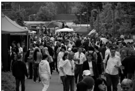
16. Aktionstag Lehrstellen

Auf dem 16. Aktionstag Lehrstellen präsentierten am 17. Mai über 120 Ausbildungsbetriebe den rund 4 500 Besuchern eine Vielzahl von Berufsbildern und Ausbildungsmöglichkeiten. An traditioneller Stätte, auf dem Gelände der Zentrum für Aus- und Weiterbildung GmbH am Ritterschlößchen 22 in Leipzig-Leutzsch, kamen die Jugendlichen und ihre Eltern mit den Personalverantwortlichen, Ausbildern, aber auch mit Lehrlingen ins Gespräch.